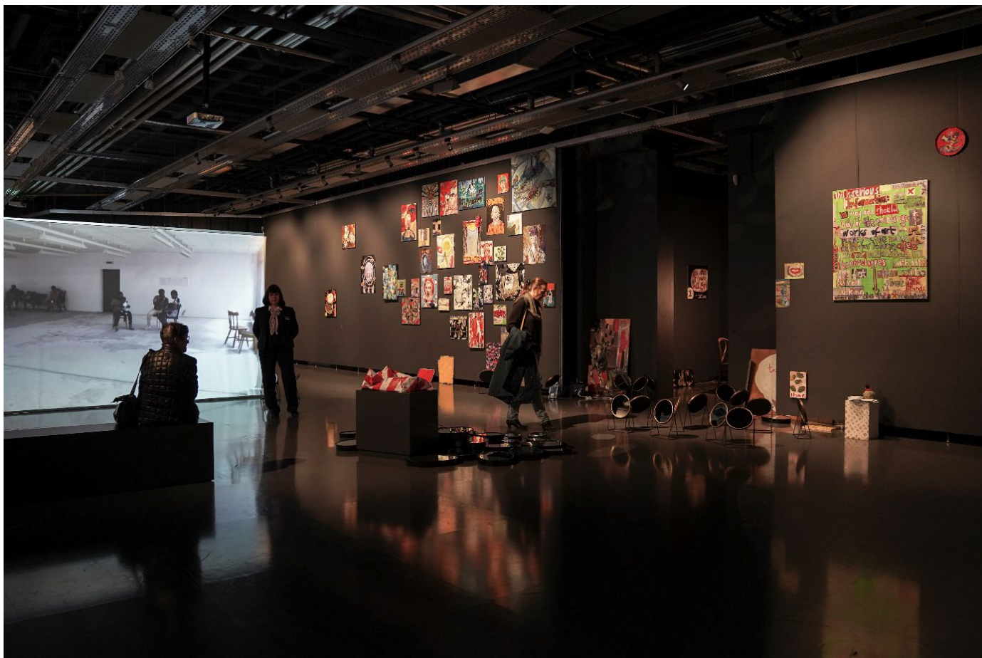
Ausstellungsansicht „Neue Kunst im Alten Schloss“, „Introducing magischer Realismus“ - 90 Gemälde und 90 Spiegel von Kerstin Schaefer, Landesmuseum Württemberg, Altes Schloss, Stuttgart Februar /März 2020