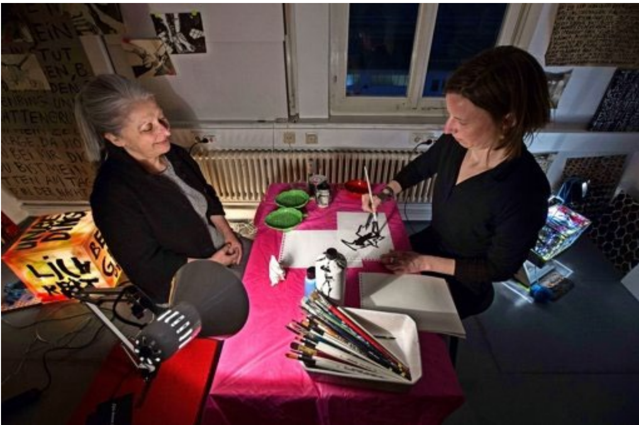
“Qui donne de l’ombre“, Installation und Performance im Klavierzimmer, Kunstakademie Esslingen, 2016