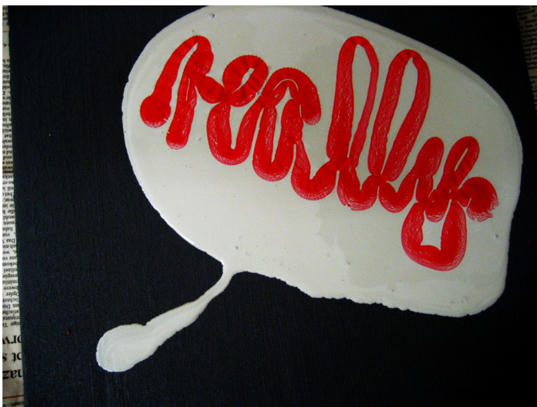
„really“, 40x40 cm, Öl und Lack auf Leinwand, 2013