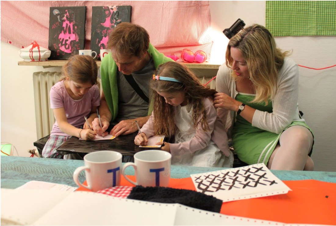
"LOTTO LOTTO BW", Grafikperformance, Kunststiftung Baden-Württemberg, Stuttgart , 2012