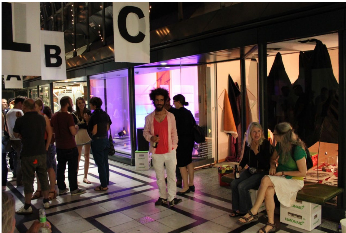
"JUST" Calwer Passagen, Stuttgart, Installation Kerstin Schaefer, 2014