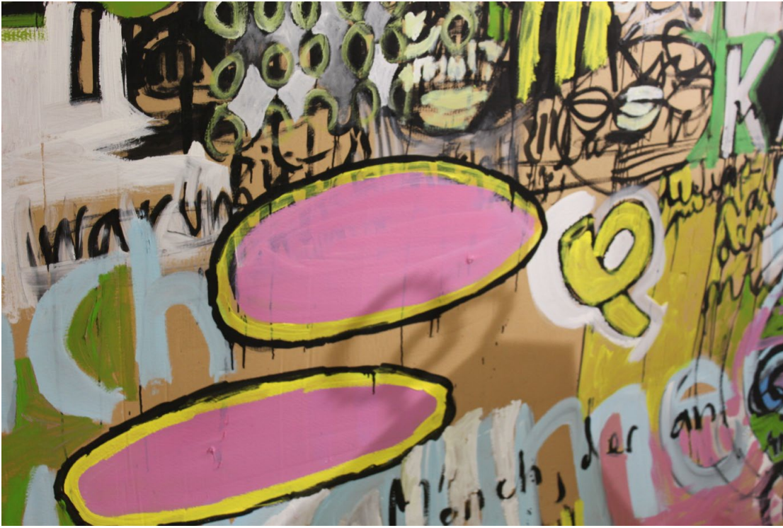
Detail „Wandbild de luxe“, 3x3m, doppelseitig bemalte Pappe, Mischtechnik, Galerie op Nord, Stuttgart, 2012