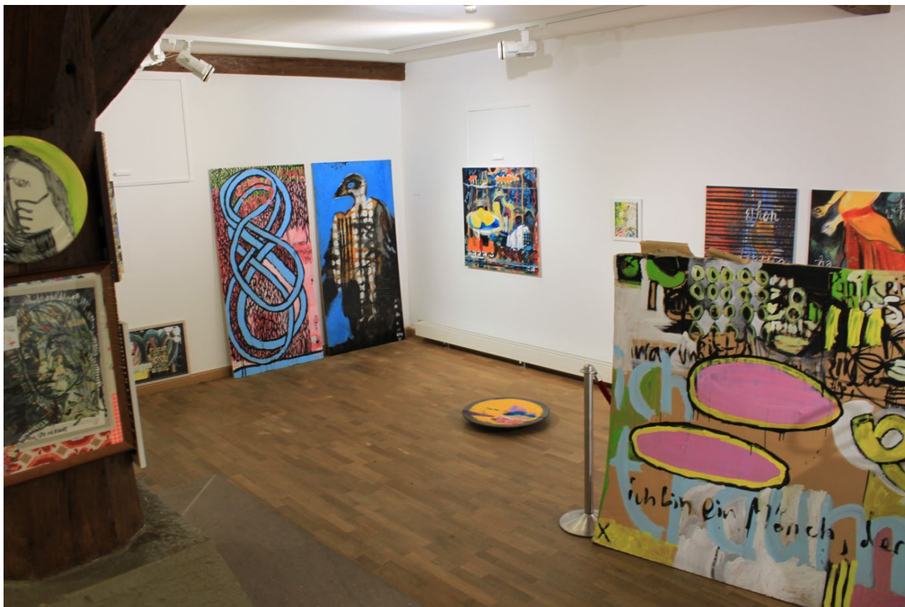
„EX VOTO“, Ausstellungsdetail, Kunstverein Brackenheim, 2012