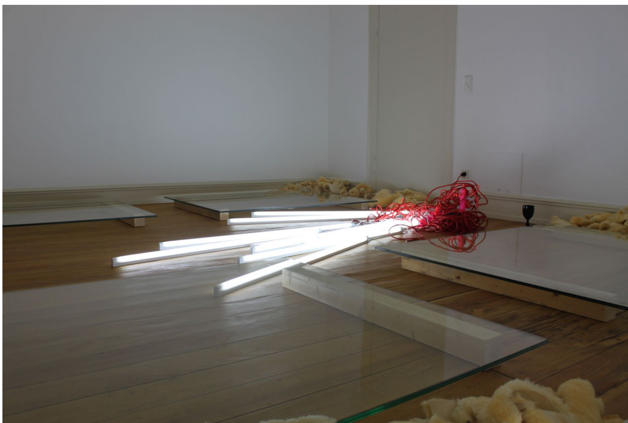
"to do a ting together", SNAG Performancetage, Villa Merkel, Esslingen, 2013