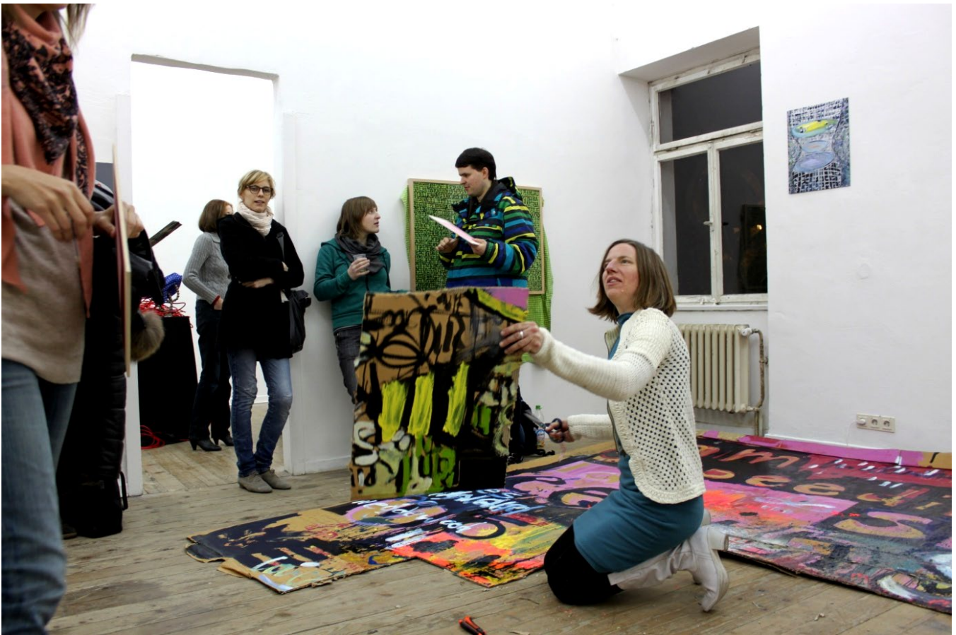
"WHEREABOUTS" mit Performance "Heilandsunderschlag", Atelierhaus Nordbahnhofstraße, Stuttgart - mit Gästen der Jungen Freunde der Staatsgalerie Stuttgart, 2013