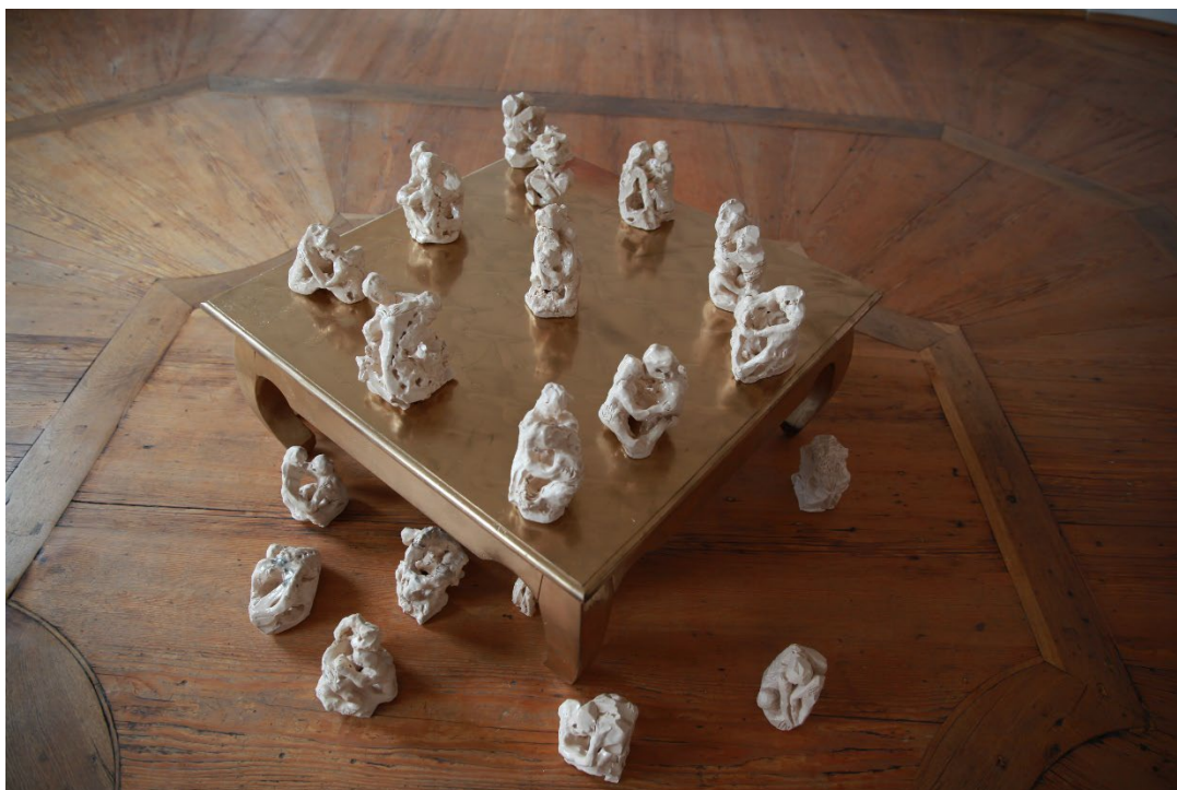
„Totentanz“, Detail, 26 Doppelfigur-Keramiken, je ca. 25x15x15cm, Stipendium KÜNSTLERHAUS STUTTGART 2023; Installation in der Ausstellung „WAW- we are wonderful“, Schloss Ellwangen, Kunstverein Ellwangen, 2023