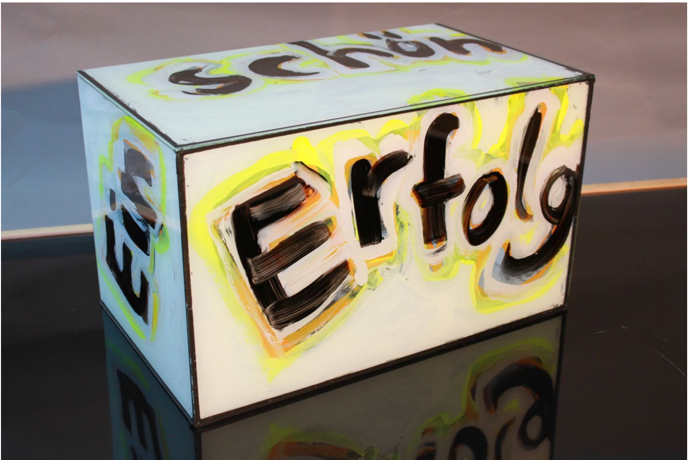
„Ein schöner Erfolg“, Lichtbox, 40x30x30 cm, Hinterglasmalerei, 2014