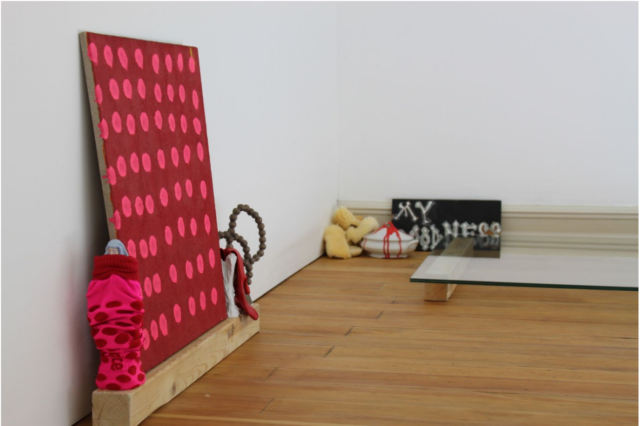
"to do a ting together", SNAG Performancetage, Villa Merkel, Esslingen, 2013